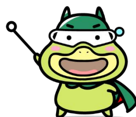
労働基準局広報キャラクター 「たしかめたん」