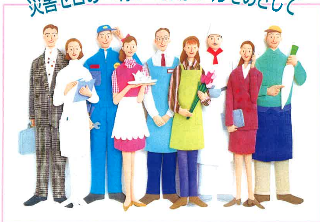
写真：カラーボックス